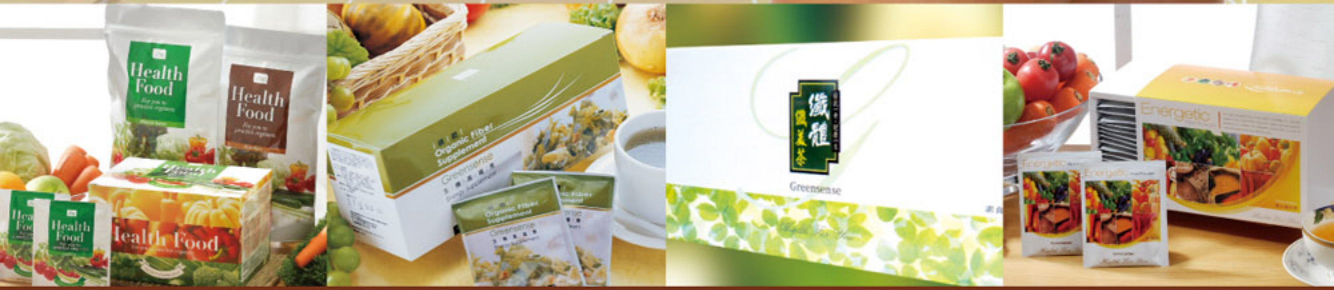
New LaSort、活力粉、養生纖活素、生機高纖素、纖美茶

NEW LaSort In Vivo Environmental Protection NEW LaSort In Vivo Environmental Protection is being processed from all kinds of plants, vegetables and lactobacillus bifidus which have gone through a special biofermentation process. It provides us with pollution-free balanced nutrition to purify our body and maintain us with an everlasting health. To Create Healthy Life 350 tablets